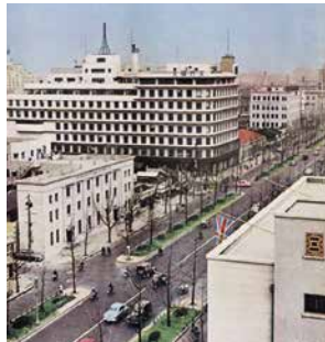
昭和30年代のガスビル

巨大な客船を思わせる白亜のガスビルが、工事中の御堂筋に面して完成したのは昭和8年3月のこと。その2ヶ月後の5月には、梅田一心斎橋間に大阪初の地下鉄が開通しました。ガスビルは、大阪のシンボリストリート御堂筋とともにその歴史を刻んでいったのです。設計者は「大阪倶楽部」や「高麗橋野村ビル」などを手がけたことでも知られる安井武雄氏。1966年(昭和41年)には北館増築が竣工しました。