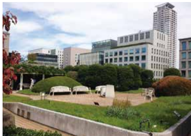
普段見られない屋上庭園の写真。憩いのスペースとなっています。