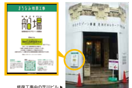
修復工事中の芝川ビル ▶

注目 協議会では、修景工事や船場のまちなみづくりのテーマ、協議会の活動などをPRする標示板を作成し、建物オーナーのご協力のもと、修景工事中の物件に掲示していただいています。船場地区内でこの看板を見かけたら・・・その建物にご注目ください!