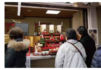
別所家のおひなさま