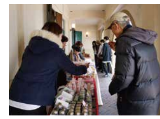
芝川ビルのひなマルシェ