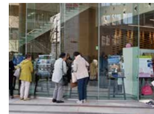
パネル展「船場のまちなみ写真展」