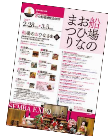
春の船場博覧会2017 船場のおひなまつりポスター