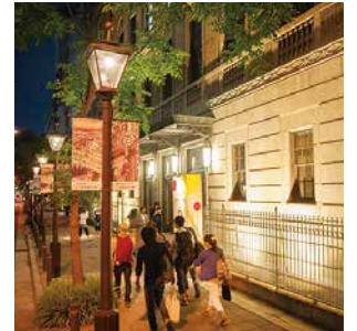
ガス燈点灯時間 17:00~23:00(冬季)