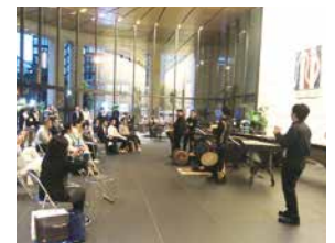
古典芸能・芸術を通じた船場地区活性化事業 古典芸能×近代建築

問合せ： http://www.midosuji.biz 御堂筋オータムギャラリー